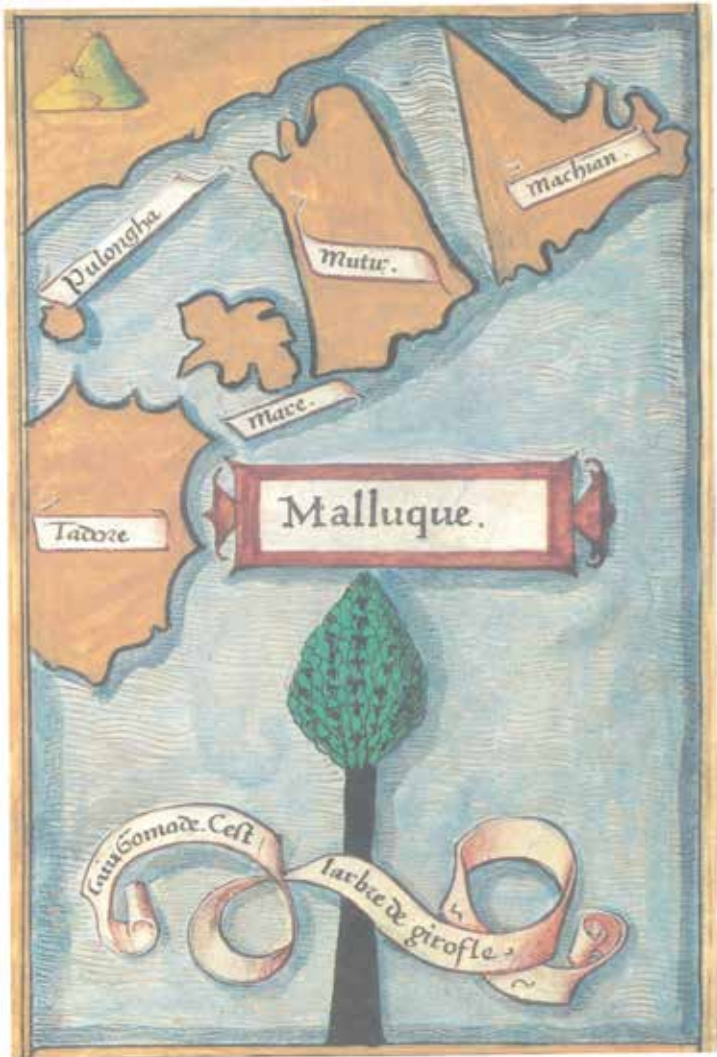
Moluk baharat adalarının stilize bir çizimi.