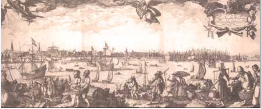
“Amsterdam limanı”, Claes Jansz Visscher

makta olan inançlar, batıl olsa dahi neden bu kitapta yer almasın? Hep merak etmişimdir, yalnızca Doğu ülkelerinde yetişen, esasen yakıcı ve acı tatları olan bunca baharat Batı ülkeleri tarafından neden çok büyük bedeller ödenerek iki bin beş yüz yıl gibi uzunca bir süredir talep ediliyordu? Bu talebin altında yatan, tutkuya dönüşecek kadar güçlü arzunun temelindeki neden neydi? Biraz sabredin, anlatacağım.