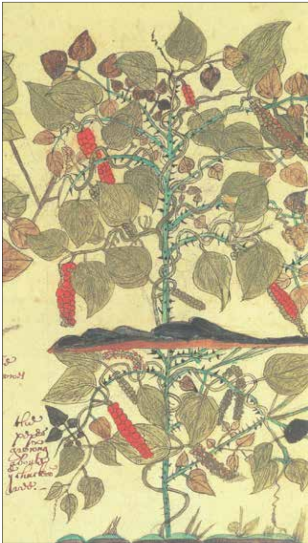
"Karabiber", British Library, Londra