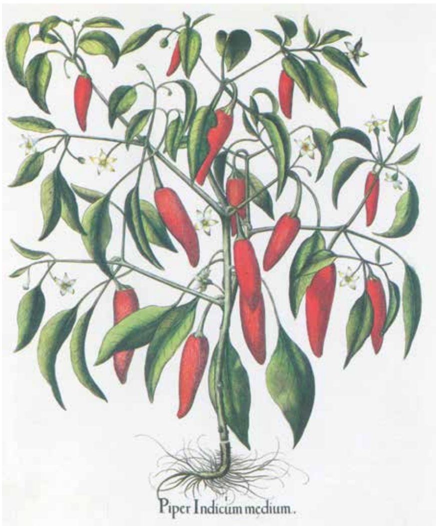
Piper Indicum medium.