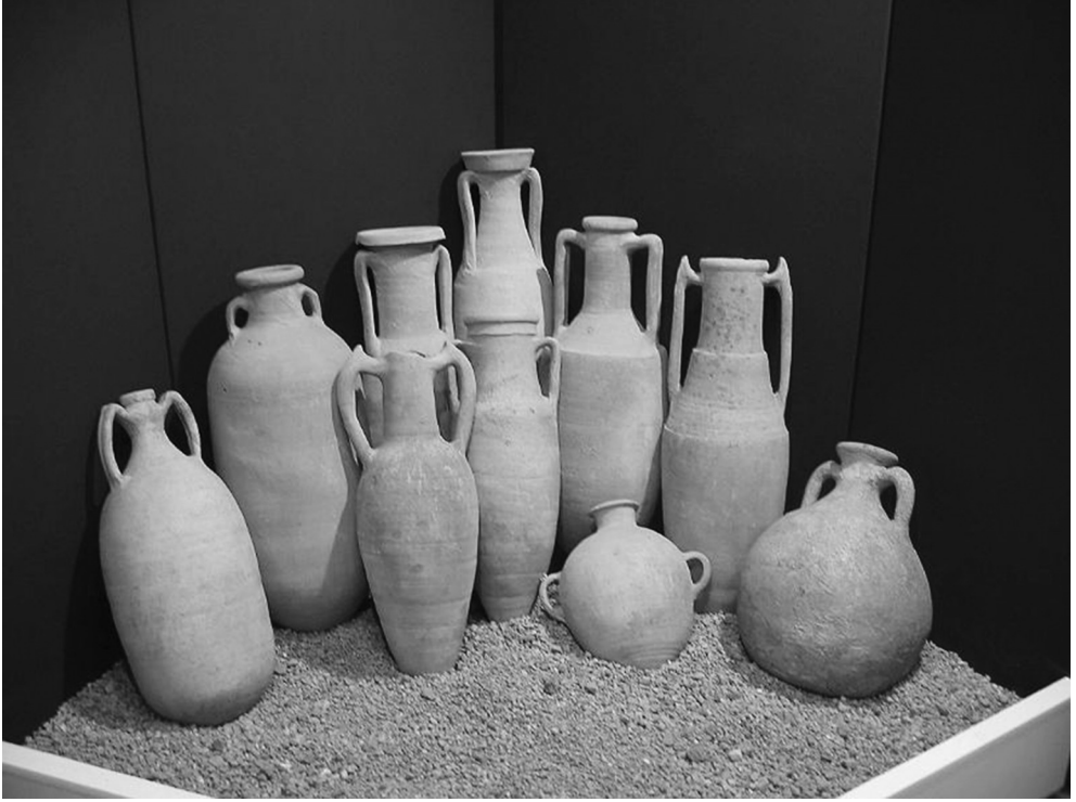
Sümer bira testileri

ticareti onların elindedir. Mısır bunları alır, karşılığını da tahıl ve tuz olarak öder. Ancak dengeyi bir türlü tutturamaz. Mısır'a da katma değeri yüksek mal gerekmektedir. Onlar da tuzlanmış gıdayı satarlar Fenikelilere. Tuzdan beş kazanıyorlarsa tuzlu gıdadan on beş kazanırlar. Alan da veren de memnundur. Şimdi size anlattığım tarih, İÖ 2800 civarındadır. Takip eden iki bin yıl içerisinde Mısırlılar bu dünya meseleleri ile uğraşmak yerine öbür dünyadaki konularını ön plana aldıkları oranda Akdeniz'de tuzlu balık ticaretinin tamamı Fenikelilerin ellerine geçmiş olacaktır. Sicilya'daki Trapani ve Tunus'taki Sfax şehirlerini Akdeniz'in tuzlanmış balık merkezi hâline getirenler Fenikelilerdir.